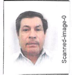
FOTO DEL SOLICITANTE

(DIRECCIÓN DE REGLAMENTOS FISCALIZACIÓN Y CONTROL.)